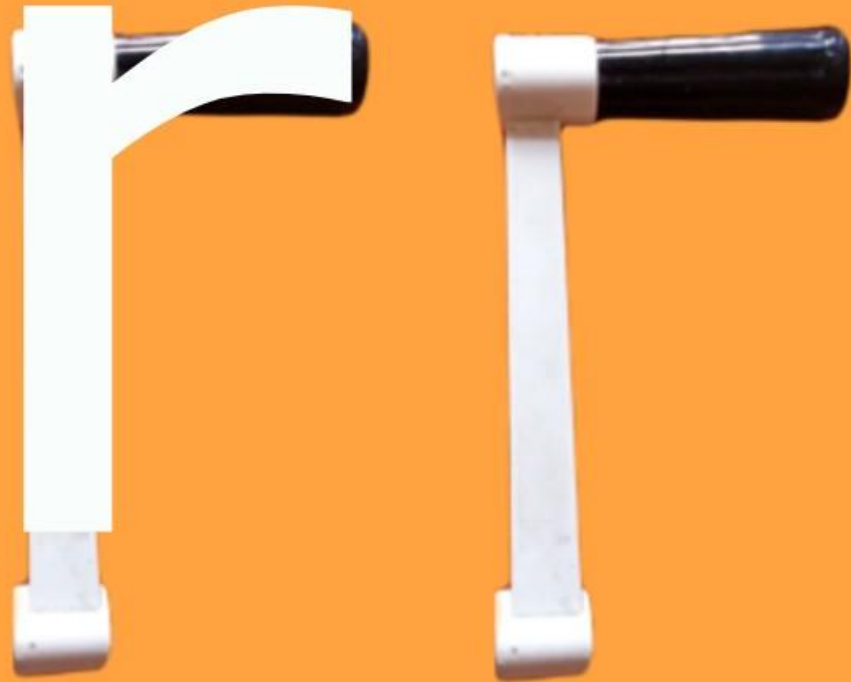
El bastón de mi abuelo